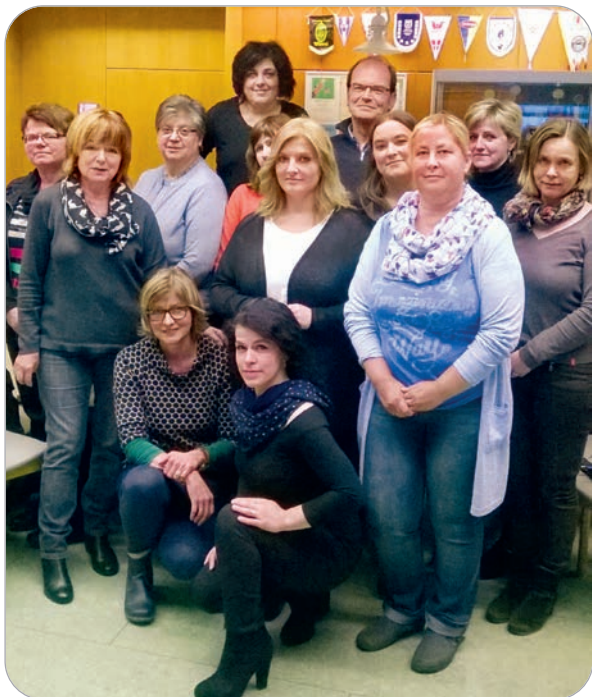
Einige Ehrenamtliche aus dem Team der Familienlotsen des Landkreises Peine im Oktober 2015. Aktuelle Informationen finden Sie hier:

📄 www.Buendnis-Familie-PE.de/index.php/veranstaltungen-details/items/familienlotsen.html